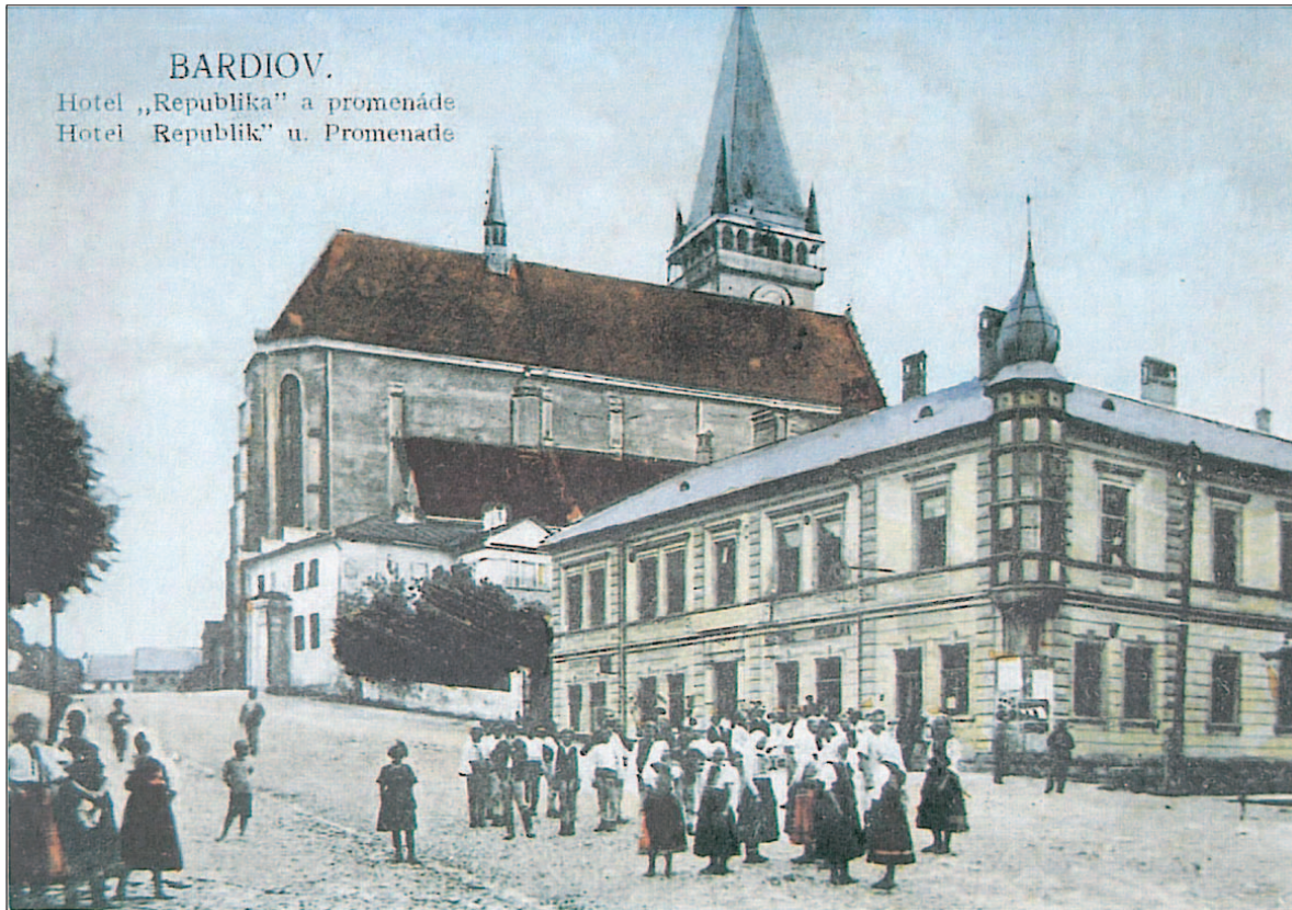
Centrum Bardejova, miesto vtedajšieho stretávania sa ľudí (dobová pohľadnica z predvojnového obdobia).